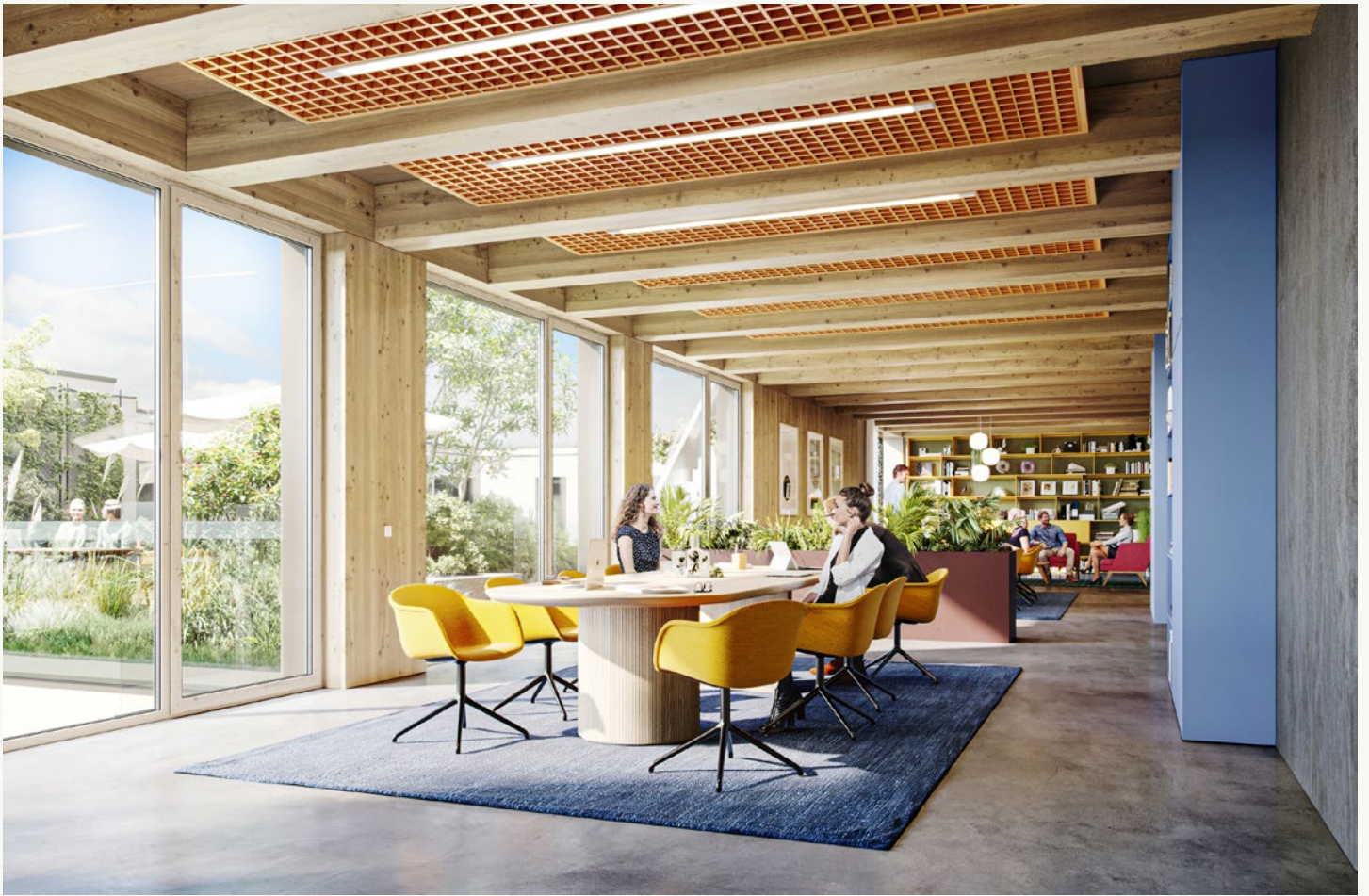
Alle Visualisierungen und die darin dargestellten Einrichtungen sind unverbindlich und dienen Illustrationszwecken.