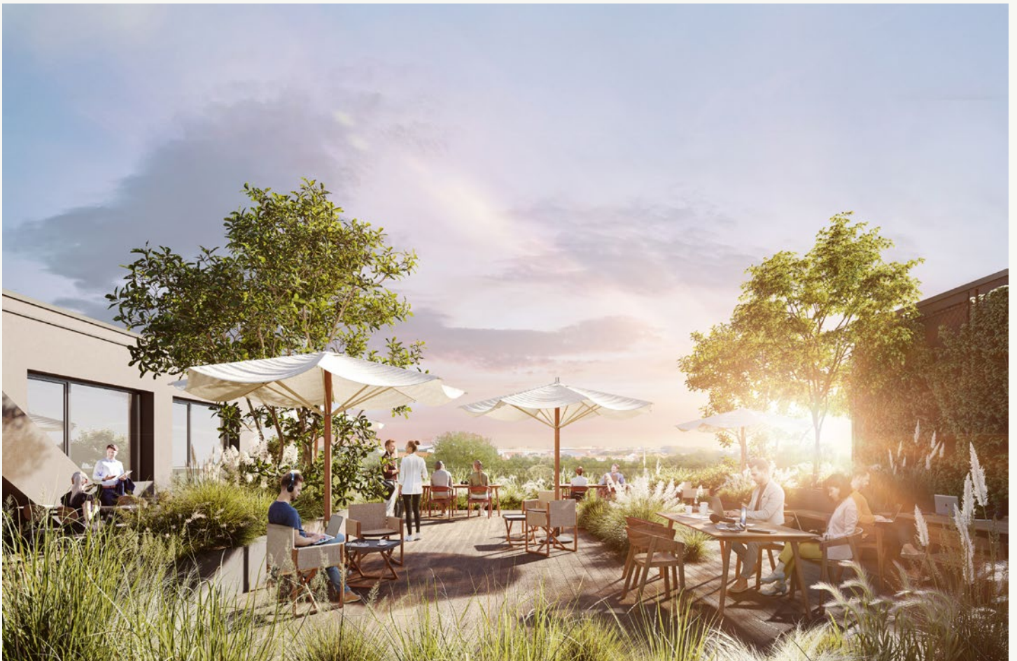
All visualizations and the facilities depicted therein are non-binding and serve illustration purposes only.